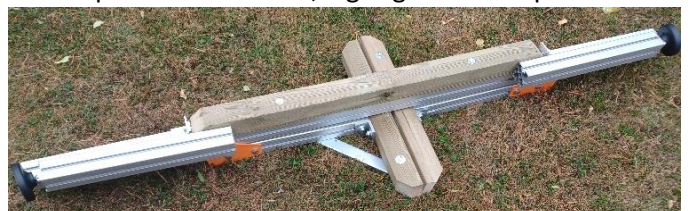
Hopfäldd vid leverans, lagring eller transport

A=Upp till 140 cm, max 1500 kg. A=160 cm, max 1100 kg Med Mittstöd , max 2000 kg per bock